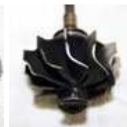
Turbinenrad an Turbinengehäuse angelaufen