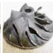
Verdichterrad an Verdichtergehäuse angelaufen