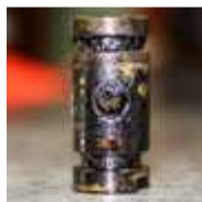
Sieb in Hohlschraube der Ölzulaufleitung zugesetzt

Folgen: Leistungsverlust und/oder starke Rauchentwicklung sowie verstärkte Laufgeräusche des Turboladers!