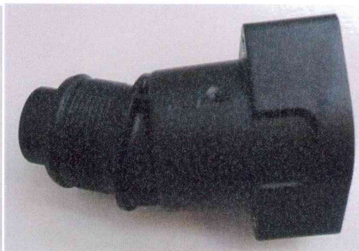
Bild 2 Dämpfer D950072

Fahrzeughersteller: VW, AUDI, SEAT, SKODA